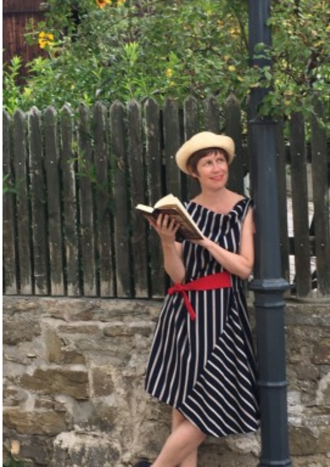
“Sievinger Geschichten”, die Stadtverführerin

Hoffentlich beschert uns der September noch warme, farbenreiche Tage und Abende!